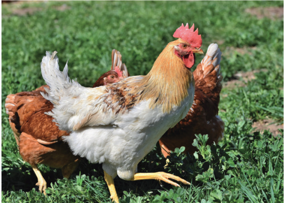
Haben die Tiere Auslauf, tritt deutlich weniger häufig Kannibalismus auf.

Für Putenmäster ist Kannibalismus kein Fremdwort. Das sogenannte „Schnäbeln“, also das Kürzen des Oberschnabels am ersten Lebenstag ist hier noch größtenteils zwingend notwendig. Besonders Putenhähne ab der 15. Lebenswoche neigen dazu schwächere Tiere anzupicken. Hier wird anhand der Körperregion unterschieden, in der es zum Kannibalismus kommt. Betroffene Körperregionen können sein der Nasenzapfen, der Rumpf oder der Stoß, also das Schwanzgefieder. Die Ursachen sind häufig ein zu heller oder zu warmer Stall. Hier gilt im Großen und Ganzen dasselbe wie für Legehennen. Den Stall etwas dunkler fahren, direkte Sonneneinstrahlung vermeiden.