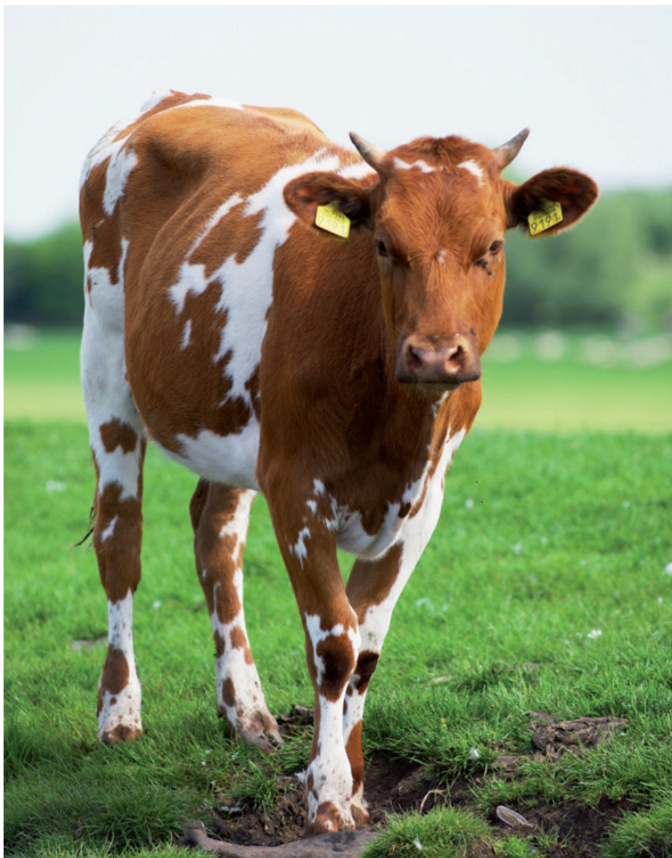
Aufgrund von Mastitis werden noch immer zu viel Antibiotika eingesetzt; hier besteht großes Senkungspotenzial.

Wie auch während der Laktation hat auch die Therapie in der Trockenstehzeit ihre Grenzen. Bei unheilbar euterkranken Tieren mit >700.000 somati-