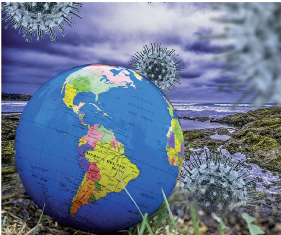
Weltweit bedrohen altbekannte und auch neue Erreger die Schweine. Es gilt, sie im Auge zu behalten, um bei Problemen schnell reagieren zu können.

Wenn man sich die Lungenbefunde am Schlachthof anschaut, sieht man, dass die Ferkelgrippe noch immer in den Schweinebeständen grassiert, insofern gehört für mich die Mykoplasmenimpfung zusammen mit der Circoimpfung immer noch zu einer Standardmaßnahme. Auch schlechte Stallluft schädigt die Lunge, so können z.B. hohe Ammoniak-Konzentrationen das Angehen einer Mykoplasmen-Infektion begünstigen. Die regelmäßige Impfung verhindert nicht die Besiedelung der Tiere mit Mycoplasma hyopneumoniae , verhindert aber die klinische Erkrankung in Form von Lungenentzündung. Je nachdem, wie die Ferkelpreise sind, denkt man an Einsparung, aber aus der Impfung auszusteigen ist ein Risiko. Wenn ich die Impfung weglassen kann, kann sich der Erreger im Organismus weiterverbreiten und Schaden verursachen. Also sollten die Saugferkel früh geimpft werden, dann bauen sie einen vernünftigen Schutz auf. Falls maternale Antikörper die Impfung beeinflussen, sind Two-shot-Vakzine besser geeignet, weil man mit der 2. Impfung eine bessere Antikörperbildung nach dem Absetzen erreicht. Ältere Zuchttiere brauchen in der Regel keine Impfung mehr, da sie